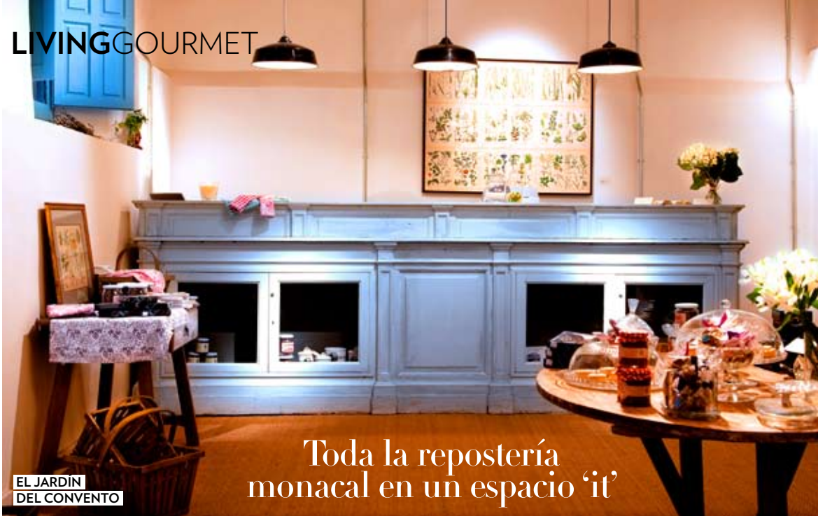
EL JARDÍN DEL CONVENTO