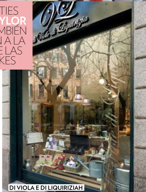
DI VIOLA E DI LIQUIRIZIAH

CELEBRITIES COMO TAYLOR SWIFT TAMBIÉN SE RINDEN A LA MODA DE LAS CUPCAKES