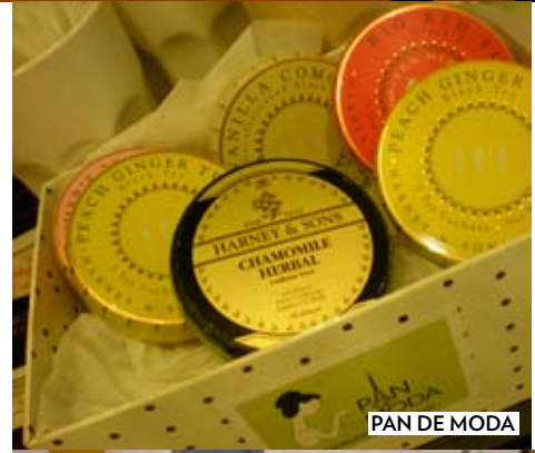
PAN DE MODA

Y si vas a Milán, no te pierdas Di Viola e Di Liquiriziah ( diviolaeliquiriziah.it ), con dulces italianos, como la pastiera , y foráneos, como los macarons , en un espacio que recuerda a las viejas bodegas milanesas. La propuesta cien por cien nacional es el Jardín del Convento ( eljardindelconvento.net ), en la calle Cerdón de Madrid. En cuanto pises este remanso de paz, será uno de tus lugares favoritos. Toda la repostería de conventos y monasterios españoles a precios terrenales, un desafío a la gula. Como escribió Oscar Wilde: "El cuerpo peca una vez y acaba con su pecado... El único medio de liberarse de una tentación es ceder a ella. Resistid y vuestra alma enfermará de deseo". ☪